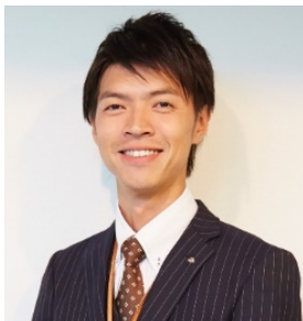
日本PCサービス株式会社 ビジネスソリューション事業本部 取締役兼本部長