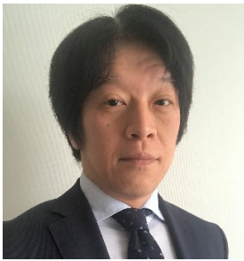
ハートコア株式会社 執行役員 Digital Transformation本部担当